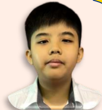
Dilaporkan oleh: Eshaan Mateen Bin Muhammad Nur Firdaus (5 Respect)